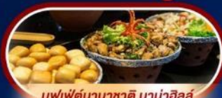
บุฟเฟต์นานาชาติ บานาฮิลล์