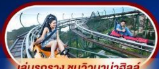
เล่นรถราง ชมวิวบานาฮิลล์